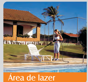
Área de lazer